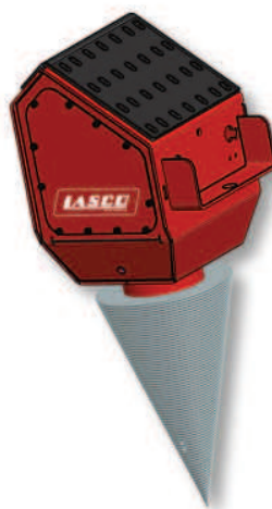
M2 5.2/6.2 S, M3 5.2/6.2 S