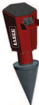
Roli 10.0 K