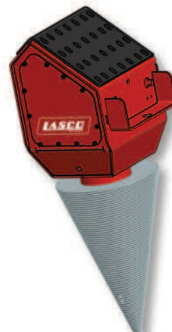
M4 5.2/6.2 XL