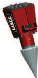
Roli 6.2 / 4.7 / 5.2